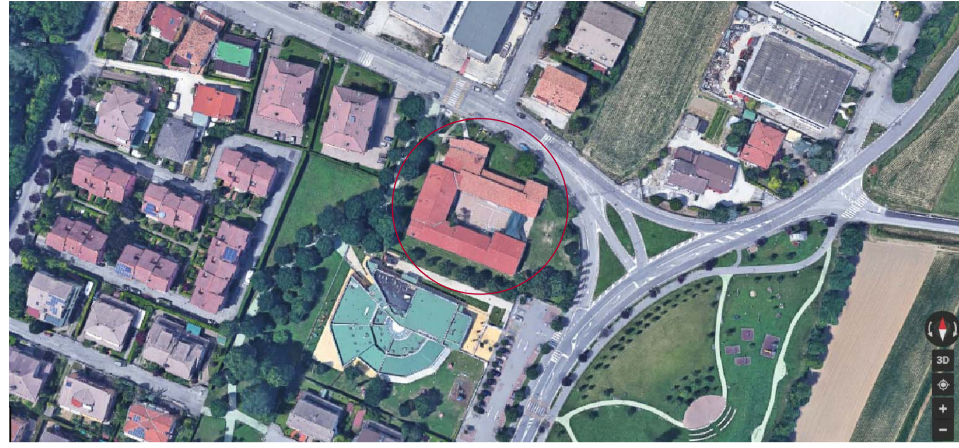
ORTOFOTO con individuazione edificio di intervento